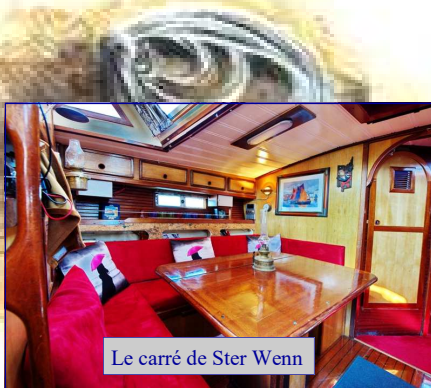
Le carré de Ster Wenn