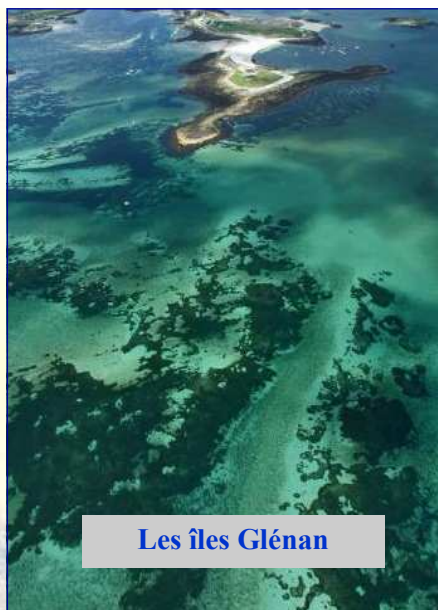
Les îles Glénan

Centre de Croisières Rennais 168 rue d'Antrain 35700 RENNES